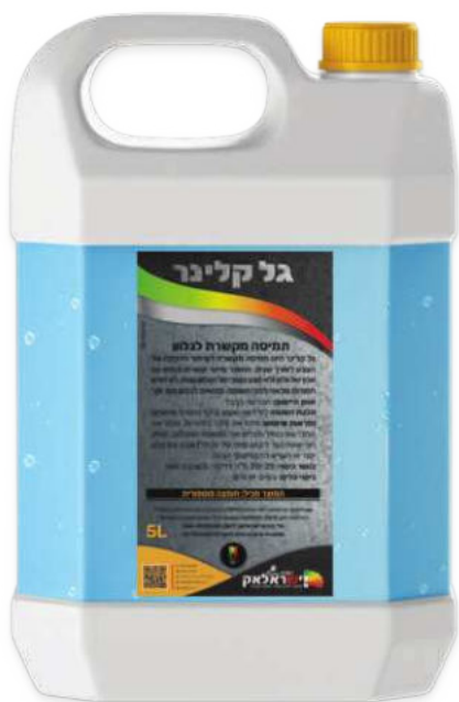
למידע נוסף לחץ כאן

מדובר במוצר המשפר את ההדבקות לצבע, בלי הכנת שטח מכאנית (ליטוש/שיוף/ניקוי חול),